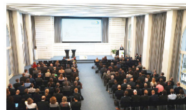
Hamburg T.R.E.N.D. in der Handelskammer Hamburg

13:20 ABSCHLIESSENDES MITTAGESSEN Ausstellungsbesuch und Verabschiedung